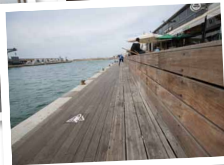
Porto Tel Aviv e Promenade em Israel. 24/11/2013